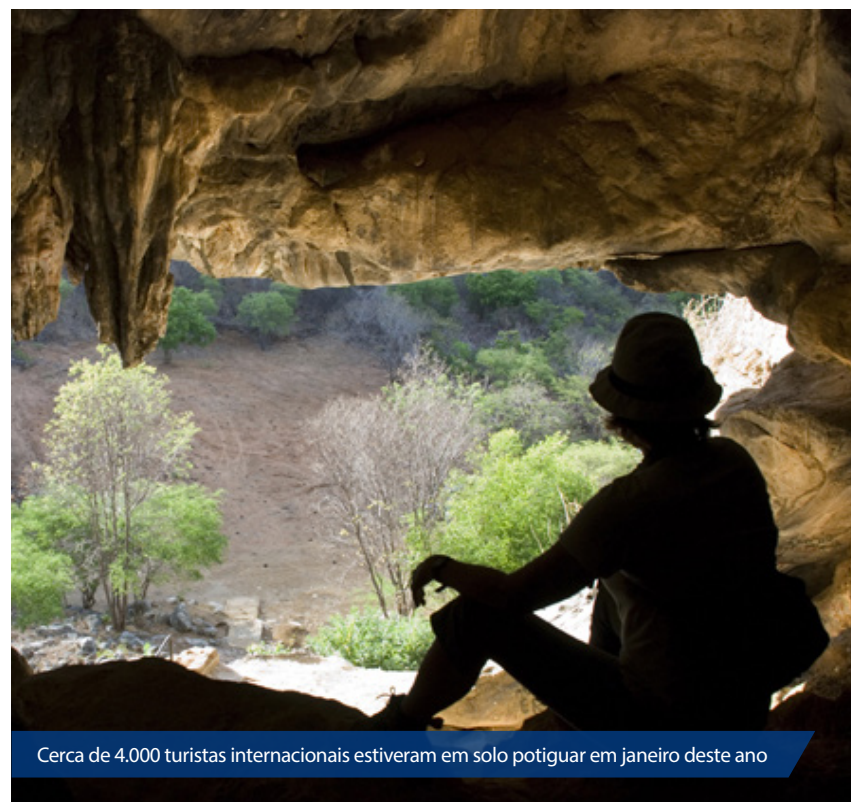
Cerca de 4.000 turistas internacionais estiveram em solo potiguar em janeiro deste ano

O ranking permanece liderado pela Argentina, país que recebeu maior investimento em divulgação pelo Governo do Estado. Foram 1.951 turistas ou 144% a mais do que o ano passado ou 47,78% do total de turistas estrangeiros no RN. Na sequência vem novamente Portugal, com 13,74% e que também mereceu destaque em campanhas de divulgação em eventos